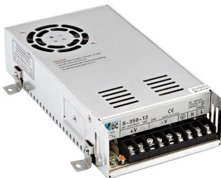
Рис. 1. Внешний вид источников питания