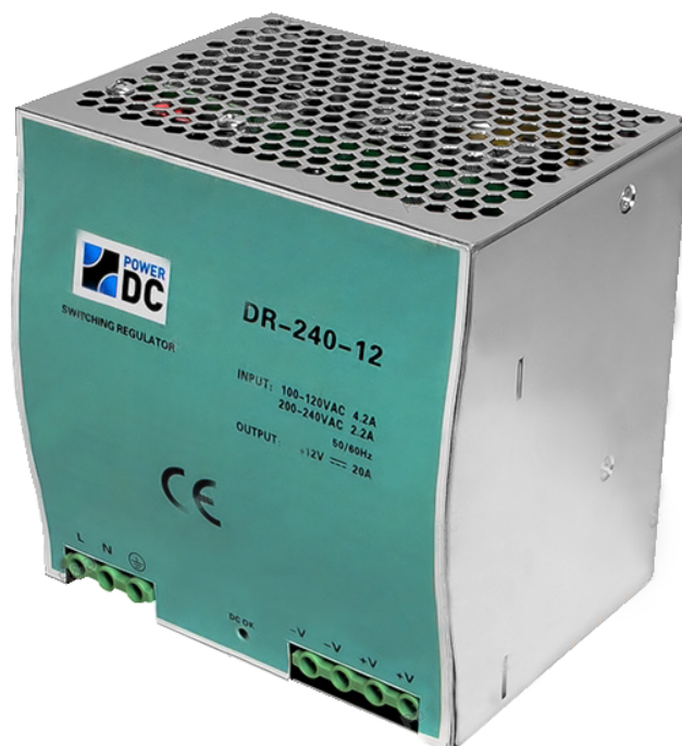
Рис. 1. Внешний вид источников питания